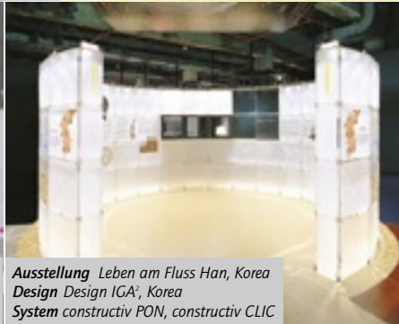
Ausstellung Leben am Fluss Han, Korea Design Design IGA 2 , Korea System constructiv PON, constructiv CLIC