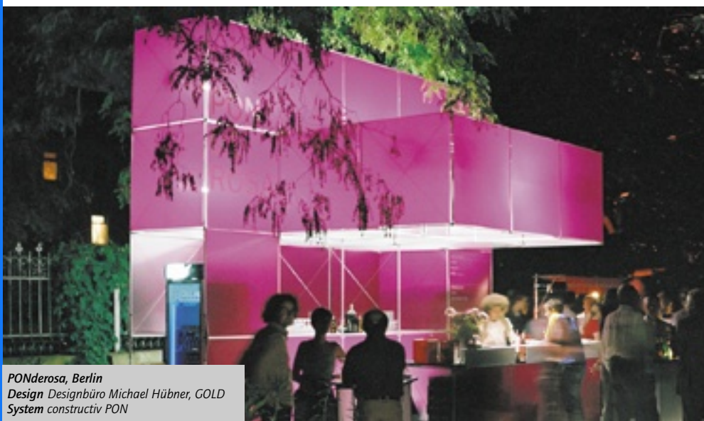
PONderosa, Berlin Design Designbüro Michael Hübner, GOLD System constructiv PON