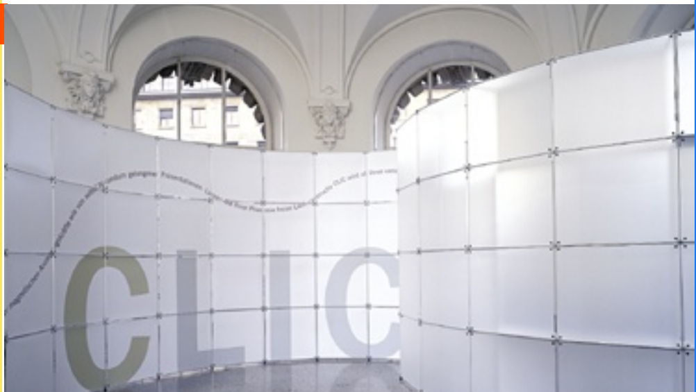
constructiv CLIC Rund Design Burkhardt Leitner constructiv, Fleischmann & Kirsch, Stuttgart System constructiv CLIC rund, constructiv CLIC

Den Nutzer überzeugt das einfache, selbst erklärende Konstruktionsprinzip, den Betrachter die reduzierte Ästhetik und den Gestalter die grafische wie architektonische Wandlungsfähigkeit.