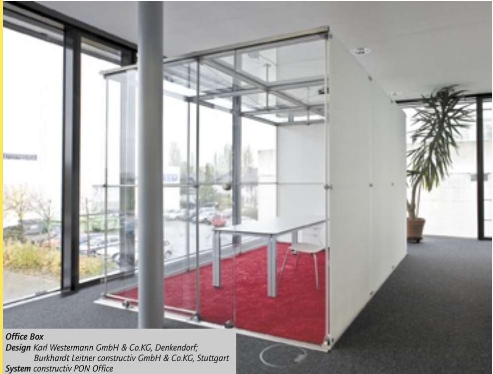
Office Box Design Karl Westermann GmbH & Co.KG, Denkendorf; Burkhardt Leitner constructiv GmbH & Co.KG, Stuttgart System constructiv PON Office

Mit constructiv PON lassen sich Raum-in-Raum-Lösungen schaffen, die das Büro völlig neu definieren. Sie gliedern den Raum in autonome, gebäudeunabhängige Office-Module. Sie schaffen in Lofts, Industriehallen oder historischen Räumen Architektur auf Zeit. Durch sie lassen sich Großräume flexibel und ständig neu strukturieren.