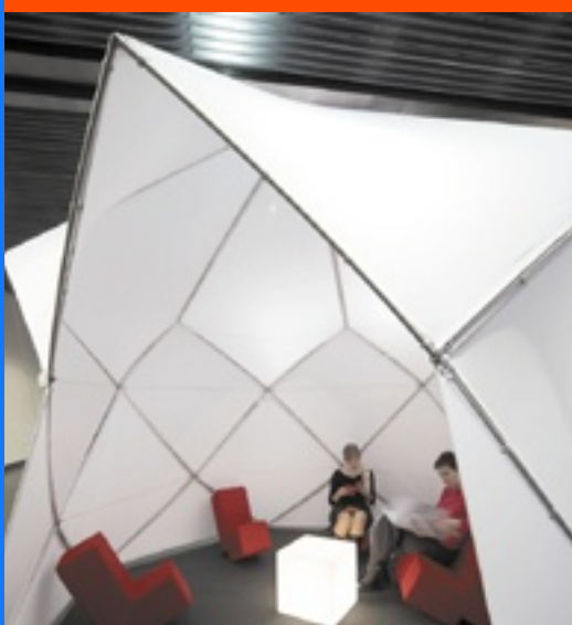
Jurte - EuroShop 2008, Düsseldorf Design Burkhardt Leitner constructiv, Stuttgart System constructiv PON Sino Größe 10 m 2

IHR SPEZIALIST für Werbe- und Messesyteme IN THÜRINGEN