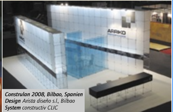
Construlan 2008, Bilbao, Spanien Design Arista diseño s.l., Bilbao System constructiv CLIC