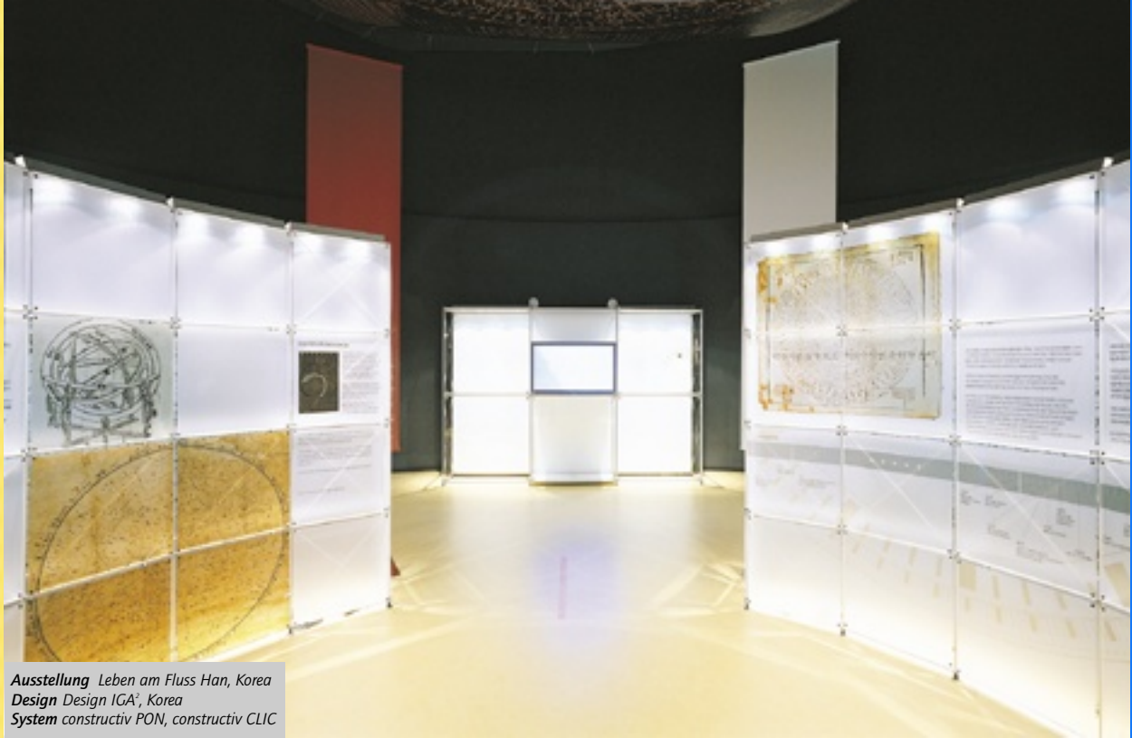
Ausstellung Leben am Fluss Han, Korea Design Design IGA 2 , Korea System constructiv PON, constructiv CLIC