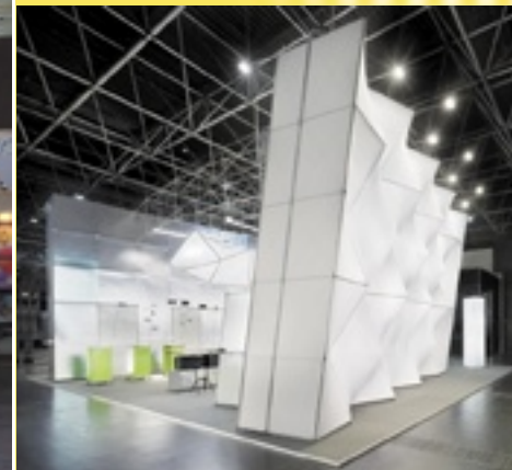
EuroShop 2008, Düsseldorf Design Burkhardt Leitner constructiv System constructiv PON, constructiv PON 7.5, constructiv PON Flex, constructiv PON Sino

Überzeugen Sie sich von den Vorteilen von Burkhardt Leitner constructiv in unserem Showroom in Wasungen!