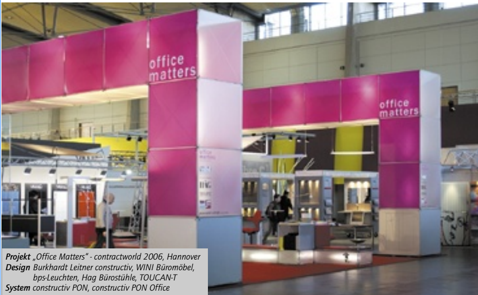
Projekt „Office Matters“ - contractworld 2006, Hannover Design Burkhardt Leitner constructiv, WINI Büromöbel, bps-Leuchten, Hag Bürostühle, TOUCANT System constructiv PON, constructiv PON Office

PON ist wie CLIC ein Knoten-Stab-System mit magnetischer Verbindung, das sich leicht ohne Werkzeug montieren und demontieren lässt. Es unterscheidet sich von CLIC vor allem in der Profilstärke der Stäbe. Extrem leicht und filigran in der Erscheinung und gleichzeitig äußerst stabil durch sein hochfestes Aluminium-Rohr ist PON ein vollwertiges Architektursystem und kann als Messe, Display, Shop-in-Shop-System eingesetzt werden. Der intelligente Verbindungsknoten ermöglicht das Einsetzen verschiedenster Platten- und Bannermaterialien innerhalb der Achse. Die ausgeklügelte Statik des Systems lässt aufregende temporäre Bauten zu.