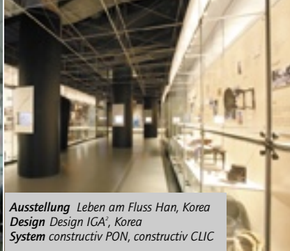
Ausstellung Leben am Fluss Han, Korea Design Design IGA, Korea System constructiv PON, constructiv CLIC