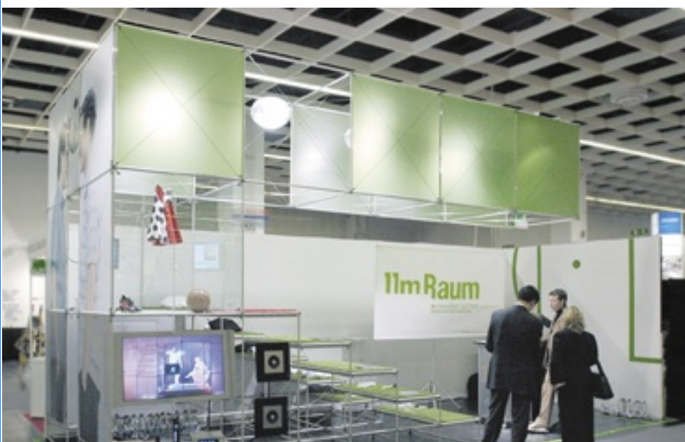
11mRaum - Exponatec 2006, Köln Design Burkhardt Leitner constructiv; Design hoch drei; huflex.com System constructiv PON, TELVIS I und TELVIS II

Überzeugen Sie sich von den Vorteilen von Burkhardt Leitner constructiv in unserem Showroom in Wasungen!