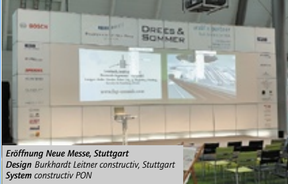
Eröffnung Neue Messe, Stuttgart Design Burkhardt Leitner constructiv, Stuttgart System constructiv PON