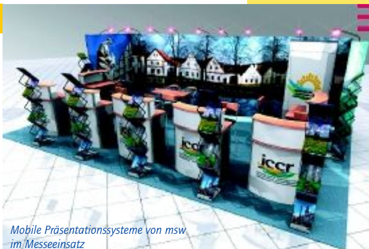
Mobile Präsentationssysteme von msw im Messeinsatz

msw bietet: eine Vielzahl mobiler und funktionaler Präsentationssysteme. Zum Produkt-Portfolio gehören modulare Rollups, Bannersysteme, Messestände und individuelle Displays.